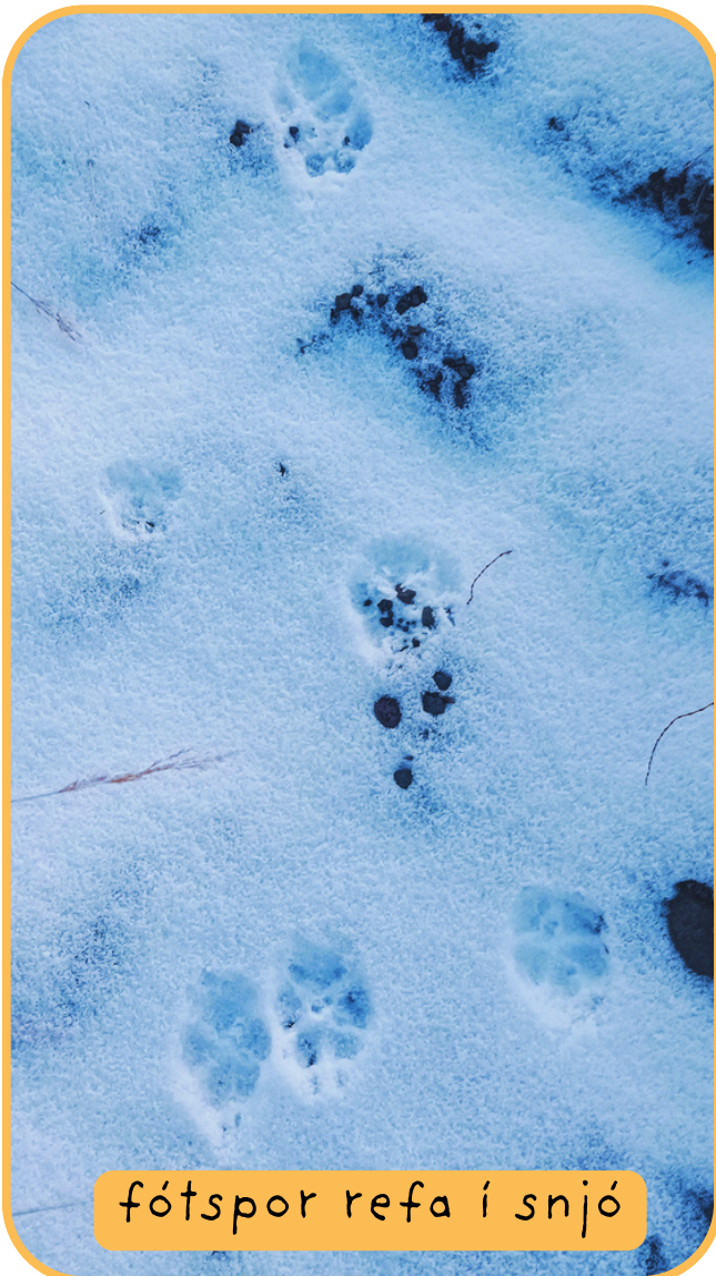
fótspor refa í snjó