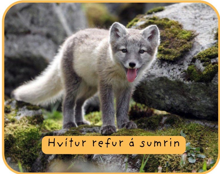
Hvítur refur á sumrin

Nafn: Melrakkir, heimskautarefur eða refur Stærð: 55 cm að lengd Þyngd: 3-4 kg að þyngd Karlkyns: Steggur Kvenkyns: Tófa eða læða Litir: Hvítur eða mórauður (blár) Fæðuval: Fuglar, egg, mýs, fiskur Fengitími: Mars Búsetusvæði: Refur býr í greni uppi á fjalli eða fjöru