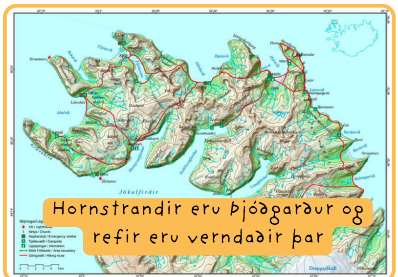
Hornstrandir eru þjóðgarður og refir eru verndaðir þar