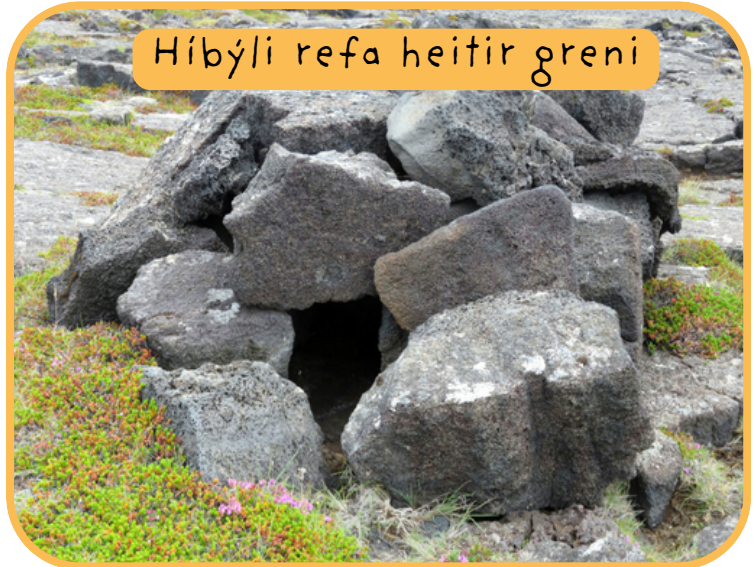
Híbyli refa heitir grena